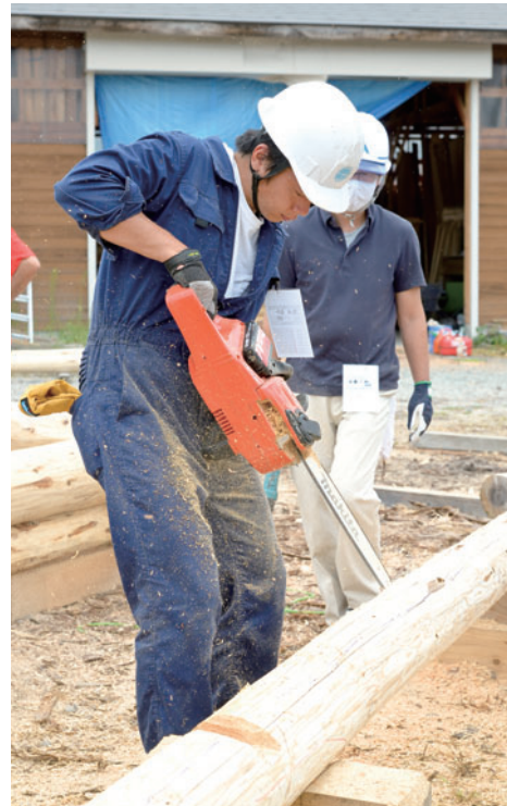
チェーンソーを使ったログワークは、ログビルディングの醍醐味。ミスしないよう、慎重にグループをカット中