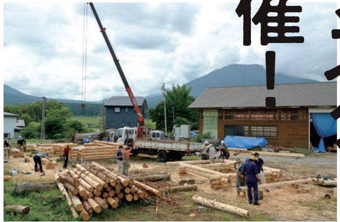
会場は信濃町の木材加工会社の敷地の一角。実際にハンドカットログハウス2棟を建てながら講習が行われた