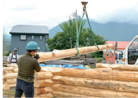
苦勞してカットしたログをユニックで持ち上げて最上段に積む。きちんとはまるかどうか、緊張の一瞬だ