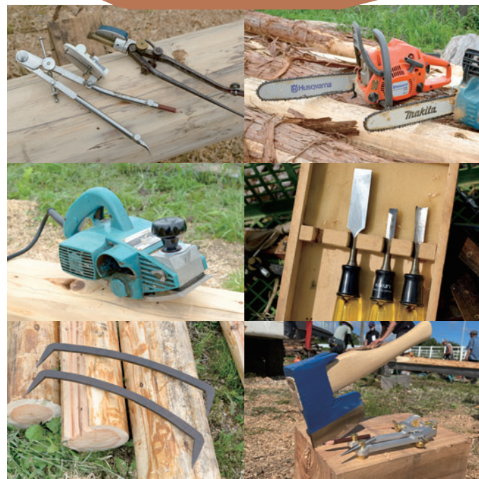
ログハウスづくりに必要な道具はそれほど多くない。エンジンではなく電動のチェーンソーが増えているのは時代の流れか