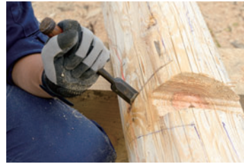
これはスコアリング作業。カットラインに切り込みを入れ、チェーンソーでカットしたときにバリが出ないようにする