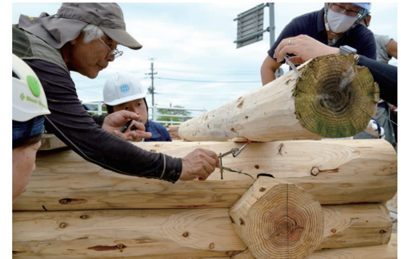
スクライバーを使い下のログの形を上ログに写し取るスクライビングは、ログハウスならではの作業。これがやってみると難しい!