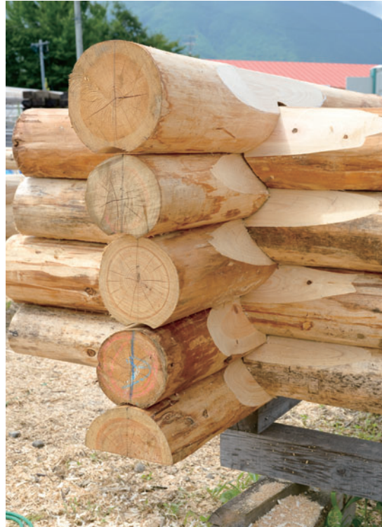
最もポピュラーなサドルノッチを使って見事に積み上がったログ壁。素人だってログハウスは建てられるのだ!